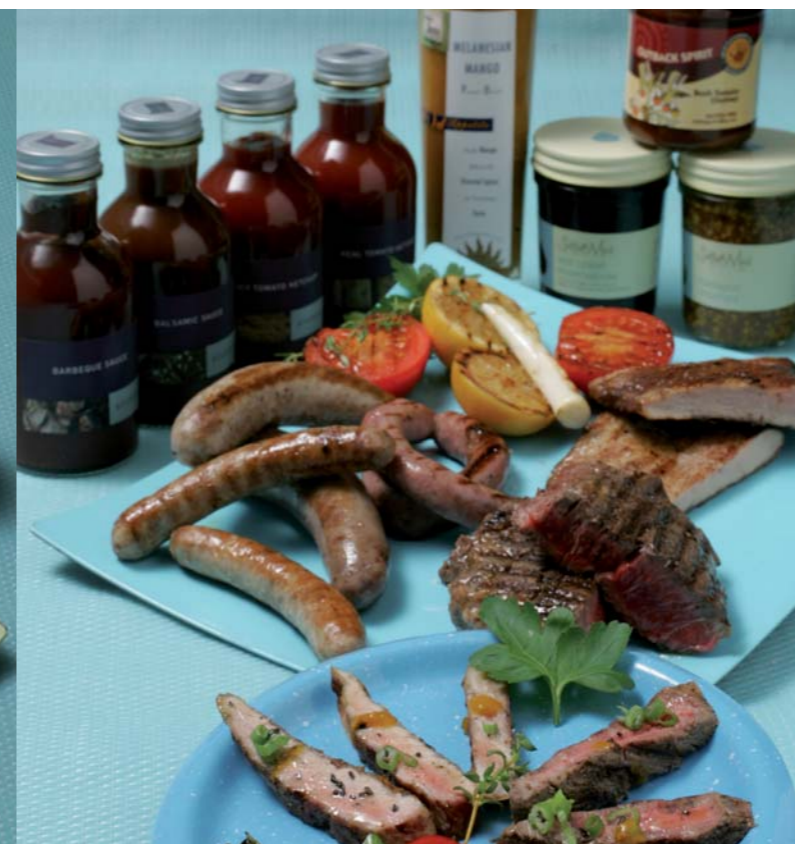
Interessante Saucen machen mehr draus!

litätsanforderungen entsprechen. Sie bietet die einzigartigen Gewürze von Oz Tukka, die schon seit Urzeiten von den Aborigines verwendet werden. Sie sind von Hand geerntet und stammen aus biologischem Anbau. Interessant für Grillgerichte ist vor allem Lemon Myrtle mit einem ganz eigenen, erfrischenden, zitronigen Geschmack, der gut mit Seafood, Schwein, Gemüse und Geflügel harmoniert. Ein tolles Grillgewürz sind auch Mountain Pepper Leafs, die Blätter des tasmanischen Pfefferbaums. Ihr Räuchergeruch mit pfeffrigem Schwung machen schon aus einer Grill-Kartoffel ein kulinarisches Highlight. Benutzt werden aber auch die Beeren dieser Bäume, die zunächst süßlichen, dann sehr scharfen Mountain Pepper Berries, die Fleischgrilladen einen besonderen Pfiff geben.