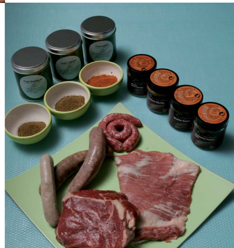
Hochwertiges Grillen verlangt nach tollen Gewürzen

Eine tolle Bezugsadresse für alle genannten Fleischsorten ist übrigens das Heinsberger Unternehmen Otto Gourmet, das eigens für die Grillsaison für einige Fleischsorten spezielle Grillzuschnitte anbietet und auch ein breites Sortiment an fantastischen Grillwürsten in petto hat.